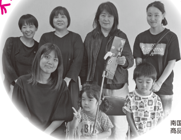
南国支所 商品活動委員会のみなさん