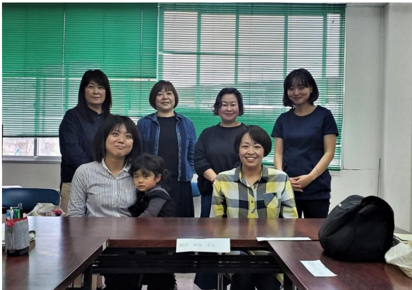
人の良さが滲み出ているミセス達でした！ 一緒に写りたかった・・・

積極的に意見を出してくれるので、そのエネルギーに負けないように、これから楽しい時間を作っていきたいと思います。