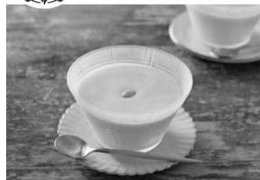
<栄養価1人分> エネルギー/173kcal