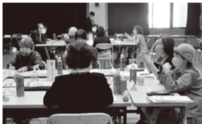
4年ぶりのテーブル交流

5月9日(火):須崎支所 5月10日(水):安田支所 5月11日(木):東支所 5月12日(金):中央支所 5月18日(木):南国支所 5月19日(金):四万十支所