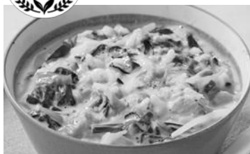
<栄養価1人分> エネルギー/253kcal