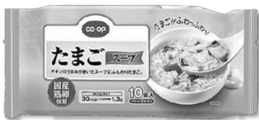
CO-OP たまごスープ (フリーズドライ)