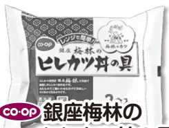
CO-OP 銀座梅林のヒレカツ丼の具

とにかく、お手軽!チンしてごはんの上のせるだけでかんたん!お昼ご飯にもお弁当にも。