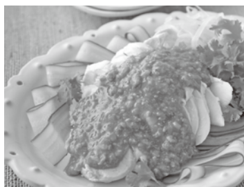
<栄養価1人分> エネルギー/142kcal